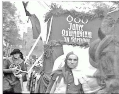
Das Standbild aus dem Film von 1938 zeigt den Umzug zum 600-jährigen Bestehen des Stendaler Gymnasiums, das an jenem Tag den Namen "Winkelmann" bekam.

In diesen Tagen wird viel über das Kriegsende vor 60 Jahren gesprochen. Die Ereignisse vom April 1945 in der Altmark sorgten auch für ein Schreiben, das der Freundeskreis des Winkelmann-Gymnasiums per E-Mail bekam. Der Amerikaner Duane Thompson ersucht darin um Hilfe, um einen Film, den sein Vater aus dem Zweiten Weltkrieg mitbrachte, richtig einordnen zu können. Im Internet habe er Bilder eines Schulgebäudes und einer Straße gefunden, die zum Film zu passen scheinen. Bilder auf der Homepage des Winkelmann-Gymnasiums.